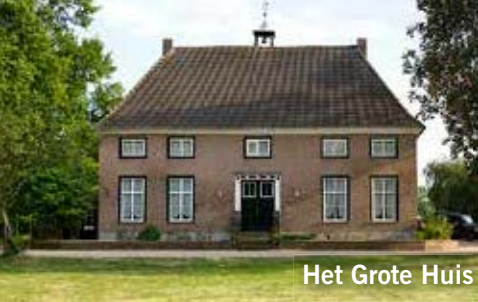
Het Grote Huis