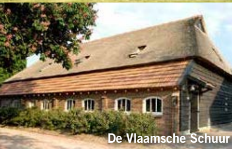
De Vlaamsche Schuur