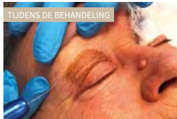
TIJDENS DE BEHANDELING